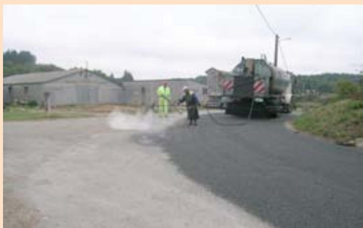
Un momento da obra que se desenvolve en Friol