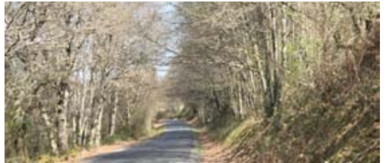
Imaxe da estrada que une as localidades de Friol e Palas

mente un ancho aproximado de 5 metros, polo que os carrís son estreitos e non contan con beiravías. Esta sección ampliarase ata os 8 metros, con dous carrís de 3,5 m de ancho cada un e beiravías de 0,5 m, salvo na zona con máis edificacións. O proxecto contempla melloras do trazado, suavizando as curvas de menor radio. Cabe salientar que se mellorará o cruce do punto quilométrico 2+100 coa estrada provincial LU-P-1611, pola que se chega a Guntín, nun sentido, e a Begonte