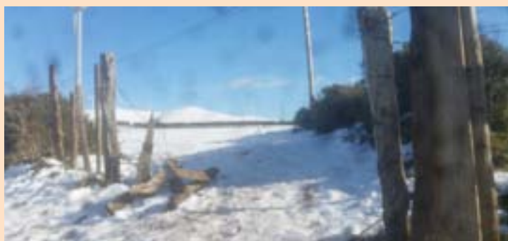
Un dos valados rotos polos visitantes

Muras foi un dos concellos aos que se achegou bo número de persoas, e non todas se comportaron do xeito máis cívico. Peches rotos, arames arrincados, sinalización esnaquizada ou moreas de lixo no chan son algunhas das situacións que os veciños de Muras foron atopando estes días nas súas terras. O Concello, en representación do