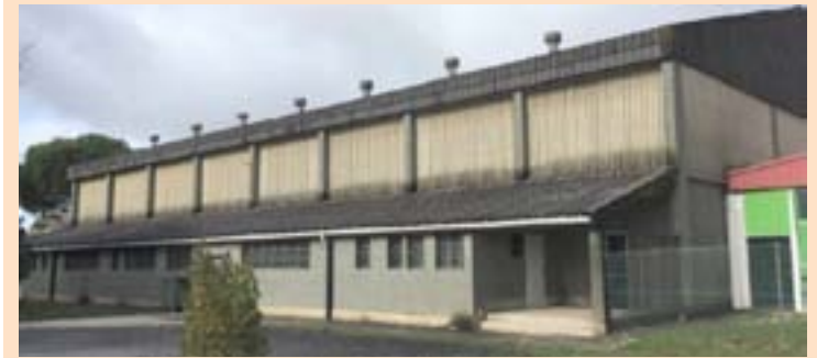
Unha imaxe do polideportivo do Monte Caxado

A Deputación da Coruña aprobou un convenio polo que achegará 180.000 euros para a renovación integral do pavillón polideportivo do antigo colexio Monte Caxado das Pontes, unha obra na que se repartirán o orzamento entre o organismo provincial e o Concello. O plan ascende a 228.796,59 euros, polo que a Deputación asumirá o 78,67 % do custo. O obxectivo desta obra é a rehabilitación da