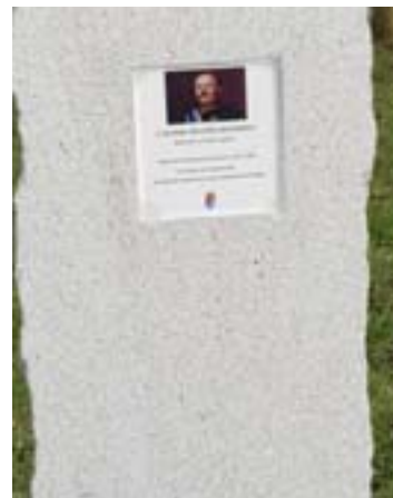
O monolito colocado en decembro