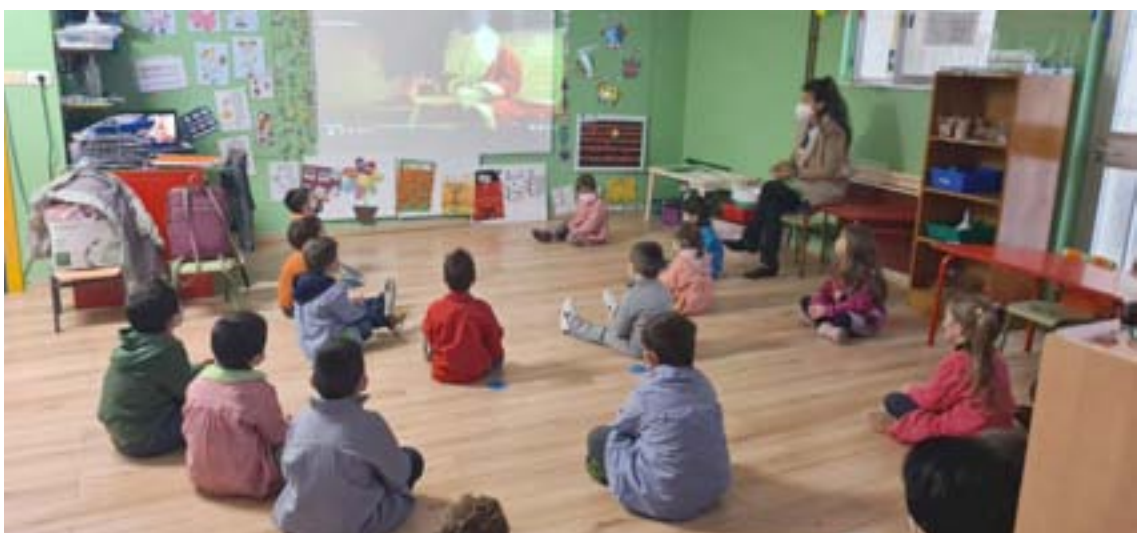
Pequenos do Ceip San Salvador da Pastoriza en videoconferencia con Papá Noel