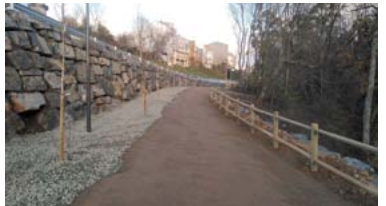
Arriba, a estrada tralas obras e, abaixo, a senda peonil paralela