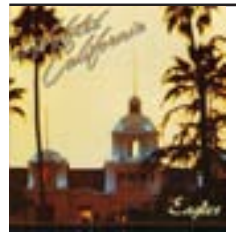
Hotel California, de Eagles