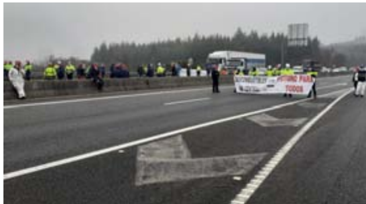
Arriba, traballadores das auxiliares no encerro, e, abaixo, o corte da estrada

de Endesa despois de finalizar a súa quenda de traballo para pasar a noite.