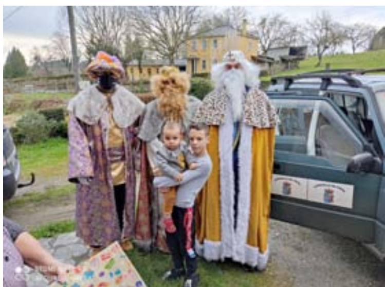
Os Reis de Friol acudiron ás casas dos pequenos a levar agasallos