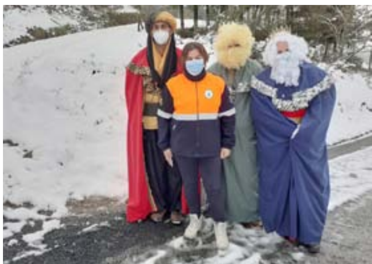
A comitiva real visitando as casas en Xermade