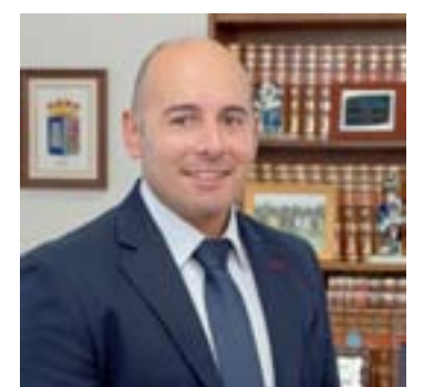
O alcalde de Friol

apoiando aos sectores comercial, empresarial e industrial reducindo as taxas municipais en termos de novas construcións ou reformas e incluso ampliacións de todas as empresas que están ou teñen previsto instalarse no noso municipio, co fin de mellorar e a captar tecido empresarial, segundo comenta o alcalde.