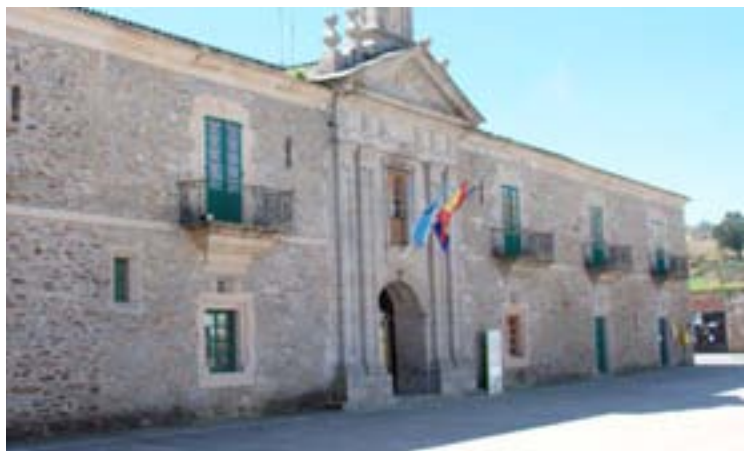
O orzamento de Meira foi aprobado só cos votos a favor dos socialistas

No capítulo de investimentos, o equipo de goberno de Meira aposta por “seguir coa dotación de servizos básicos aos veciños”, principalmente coa mellora dos accesos a núcleos e as traídas de auga, contando co apoio das administracións públicas, indicou o rexedor. Entre as principais actua-