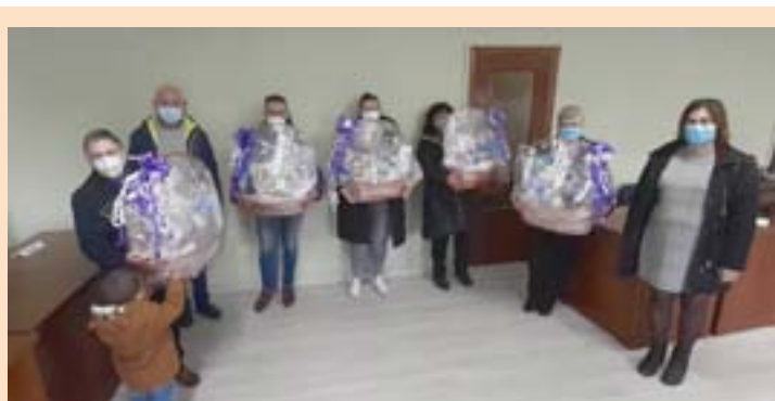
O momento da entrega dos premios do concurso de decoración

contará cunha capacidade de almacenamento de auga de entre 3.500 e 4.000 litros, "permitíndonos, ademais de loitar contra os lumes, levar auga aos pozos das casas dos veciños e veciñas cando así o necesiten", afirmou Roberto García Pernas.