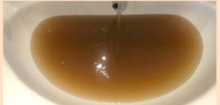
Auga da traída en Rábade nunha imaxe de arquivo

A maxistrada critica a actitude da Consellería de Sanidade durante o incidente de xullo, que archiou a denuncia veciñal e deixou pasar