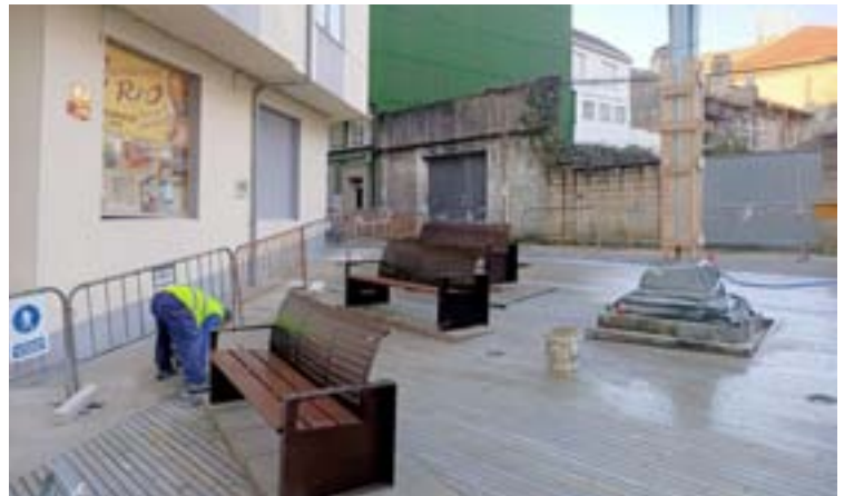
Arriba, o acceso a Cascamaño e, abaixo, a praza do Cruceiro

amaño, na parroquia de Codesido. Os traballos, cun orzamento de 21.000 euros, forman parte do plan integral de mantemento e renovación de viais e camiños nas parroquias de Vilalba, posto en marcha polo actual grupo de goberno no concello.