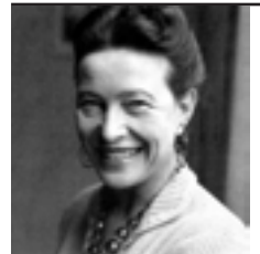
Simone de Beauvoir