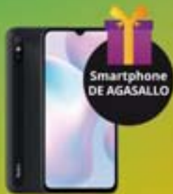
Xiaomi Redmi 9A