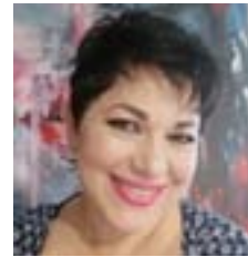
Adolfinha Mesa Artista