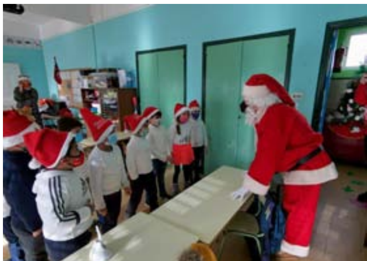
Papá Noel visitando o colexio de Rábade