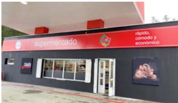
A novas instalacións de Gadisa na área de servizo de Fontefría

A presentación deste vídeo forma parte dun programa de actividades para implicar a toda a poboación neste Ano Santo.