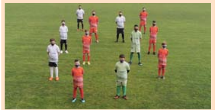
CASTRO. O CD Castro aproveitou o novo ano para presentar a súas novas equipacións para a tempada e nas que o vermello segue a ser a cor preponderante, cambio que coincide coa celebración dos 40 anos de existencia dos equipos do CD Castro.

Así, na categoría xuvenil galega estarán os equipos Residencia, Viveiro e Vilalbés B, na cadete a representación é a máis numerosa co Mi-