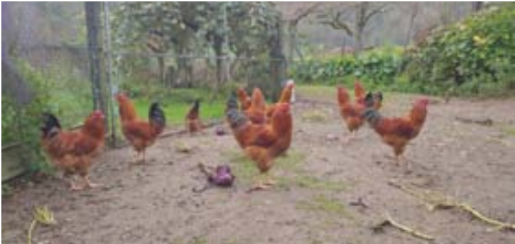
A galiña de Mos, unha das razas autóctonas galegas