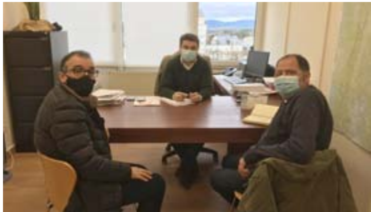
Reunión dos hostaleiros co Concello de Vilalba

En concreto, estudan as posibilidades de adaptación das terrazas