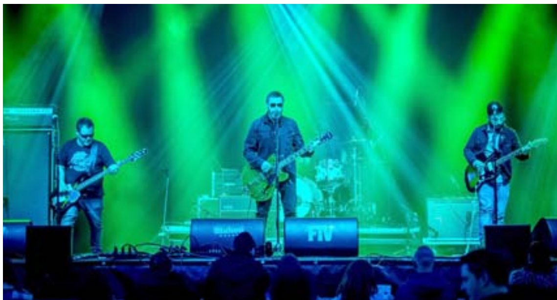
Unha imaxe do grupo chairego sobre o escenario actuando no ano 2018 no festival FIV de Vilalba