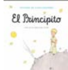
El principito, de Saint-Exupéry