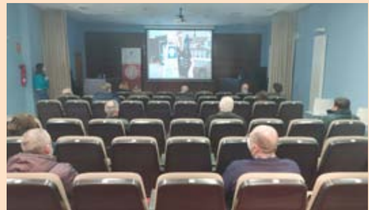
Un momento da presentación do vídeo en Begonte

Xusto no Nadal, os manifestantes, liderados pola Asociación de Veciños Montenegro e a anpa do centro, organizaron unha cacerolada que contou cunha ampla participación.