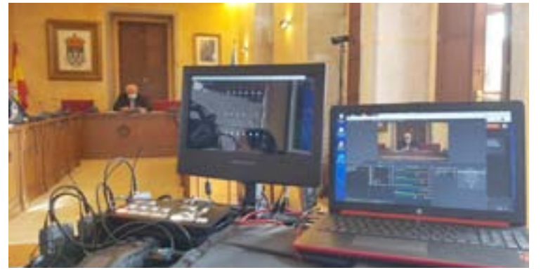
O novo sistema informático implantado no salón de plenos

O BNG interpelou de novo ao alcalde, manifestando o descontento existen na veciñanza co estado da auga en canto chove cun pouco de intensidade. Nesa liña, pregun-