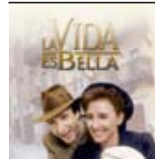
La vida es bella de Roberto Benigni