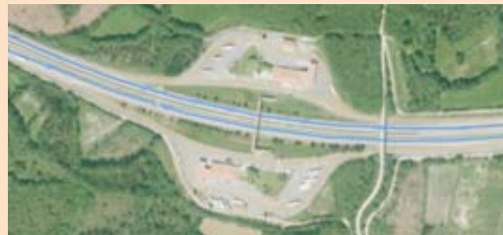
Unha vista da área de servizo guitiricense

O Ministerio de Transportes, Movilidad e Axenda Urbana licitou un contrato de concesión de servizos para a explotación da área de servizo de Guitiriz, situada a ambas as marxes da Autovía do Noroeste na A6, á altura do PK 538.