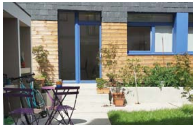
Arriba, unha imaxe do hotel Casa da Galbana e, abaixo, o patio na zona interior

mente comezar apostando por un evento, un concerto ou unha obra. Coa situación sanitaria na que vivimos non nos atrevimos e optamos por facer unha xornada de portas abertas, un percorrido pola Casa da Galbana. A verdade é que houbo moita xente interesada en coñecer o proxecto, as sensacións foron moi boas e paréceme que o pobo ten gañas de apuntarse a facer cousas.