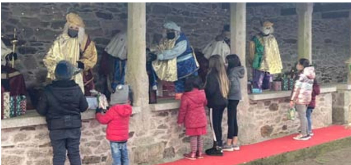
Os Reis Magos recibiron con distancia de seguridade aos nenos en Parga