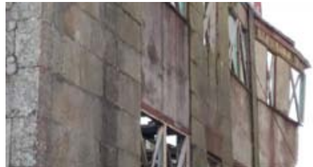
Una vista da zona afectada da fachada da Casa da Botica

A institución provincial solicitou informes de avaliación do acontecido á dirección da obra, á dirección de execución e á empresa encargada