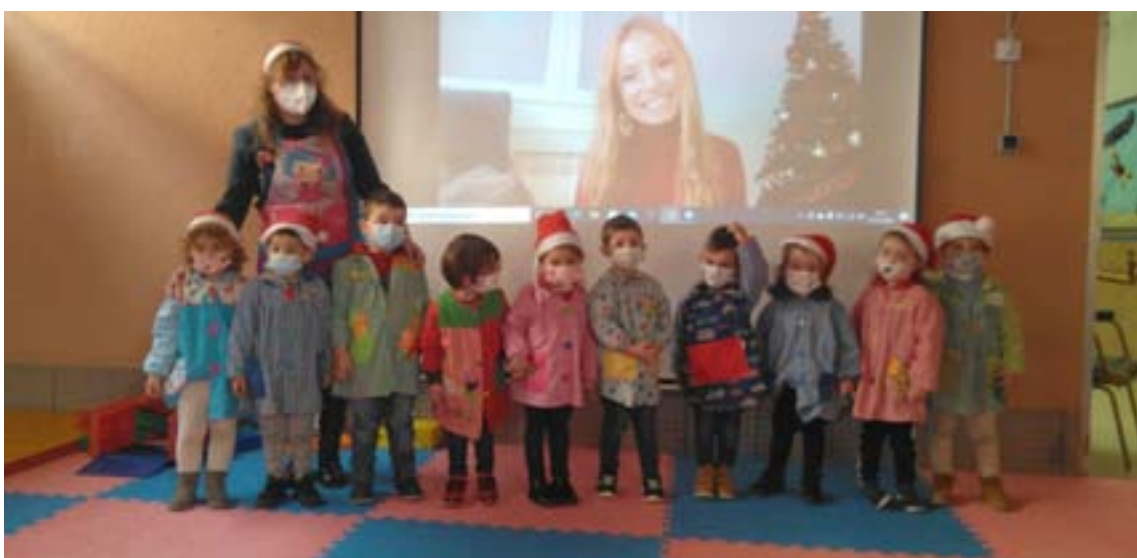
Alumnos do Ceip Terra Chá de Vilalba en videoconferencia coa presentadora Rocío Padín