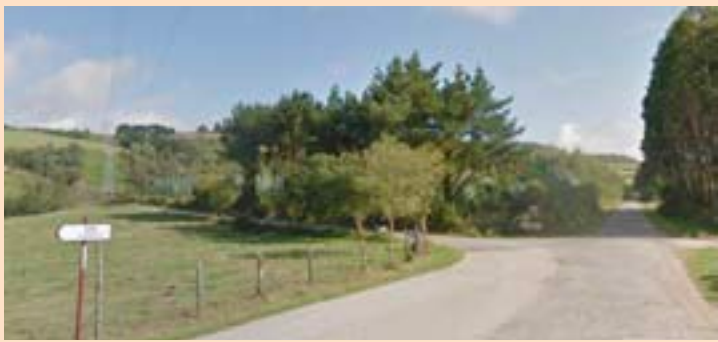
A estrada L-P-1106 ao seu paso por Xemil