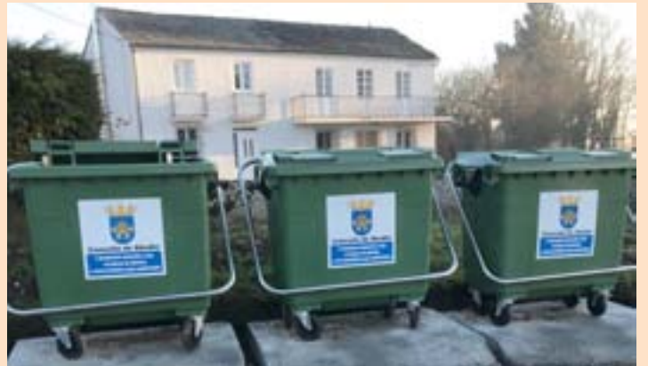
Os novos contedores do Concello de Abadín