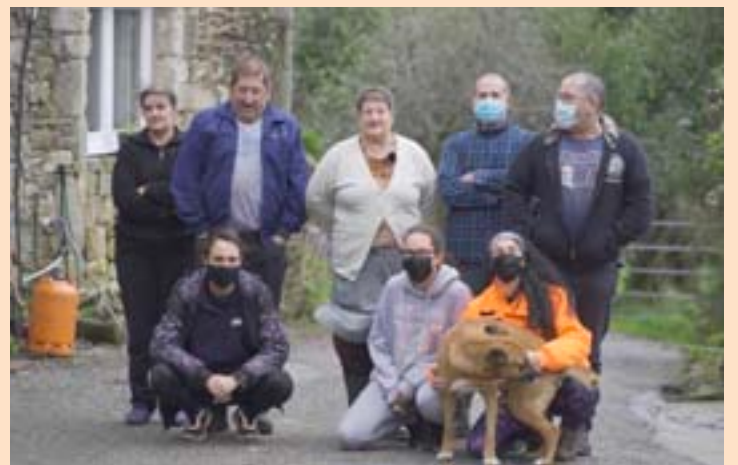
Captura dun momento do vídeo dos veciños

conxunto da veciñanza, amosou o seu pesar polos danos rexistrados, que supuxeron para moitos un gasto ou un traballo extra, tendo mesmo nalgúns casos que cambiar o gando de leira para evitar que escapase. Desde o Concello de Muras agradecen todas as visitas que recibe o municipio pero fan un chamado ao civismo.