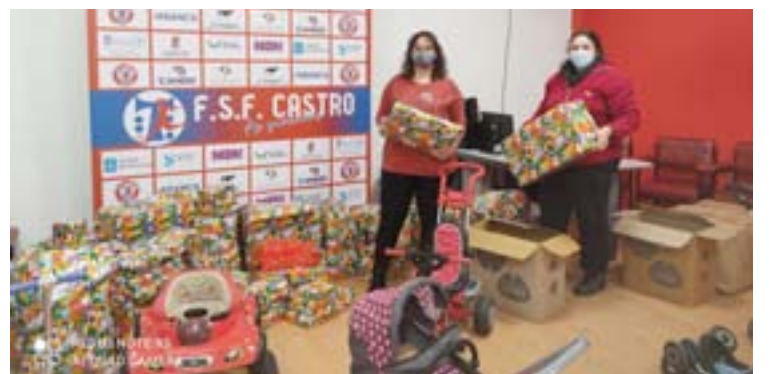
Directiva do club cos produtos recollidos

A entidade deportiva iniciou a recollida un mes atrás, tal e como fai dende hai cinco anos, aínda que nesta ocasión co obxectivo máis forte debido á crise sanitaria actual, que está a causar unha forte crise económica. Se antes eran só agasallos, nesta ocasión tamén recolleron roupa. E como en tempos así a xente aínda é máis solidaria, as doazóns foron maiores. Trala recollida, veu o traballo de desinfectar, limpar e envolver