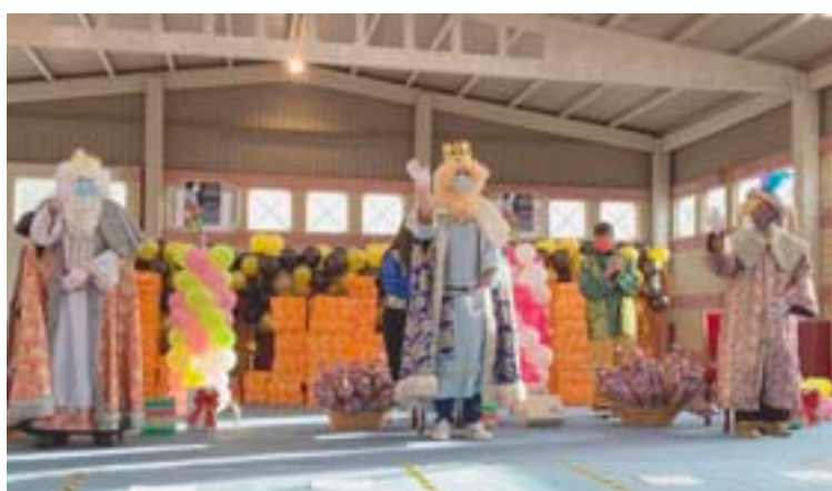
Os Reis Magos tamén estiveron en Begonte