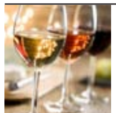
Viño tinto ou branco

Consulta os eventos en: www.terrachaxa.com