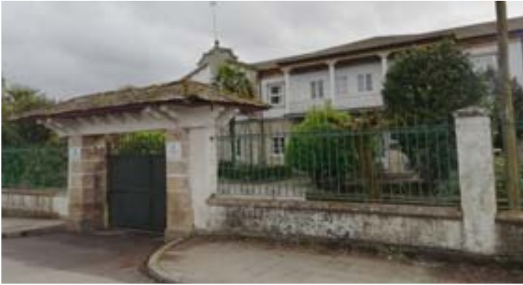
O centro de menores Santo Anxo de Rábade