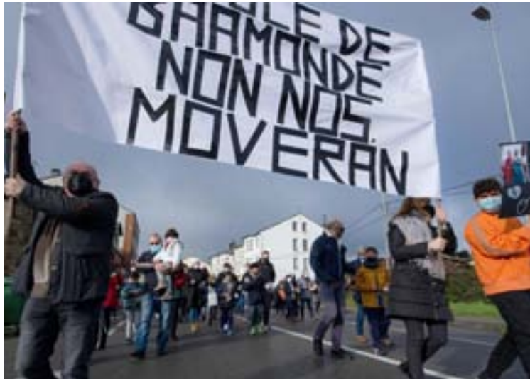
Concentración e cacerolada realizada en Baamonde

Non pararon as protestas e todos os domingo pola mañá organizan algunha actividade de protesta. De feito, dende que se deu a coñecer o proxecto, non pararon