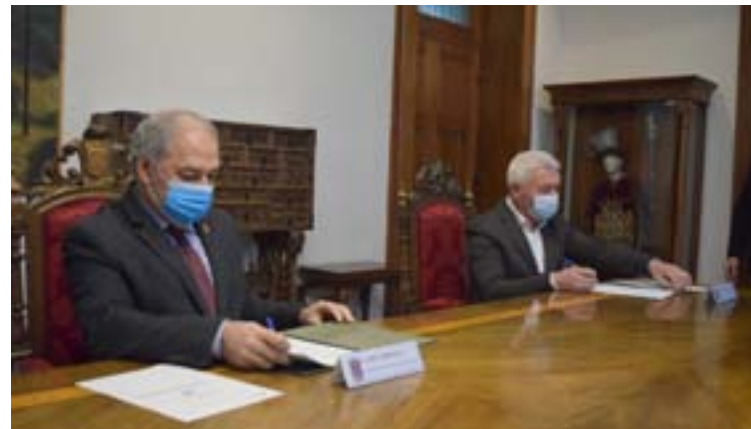
Firma do convenio entre a Deputación e o Concello

Pola súa banda, o alcalde xermadense explicou que o Concello conta, na actualidade, cun pequeno camión que non cubre as necesidades para facer fronte a un lume. "Con esta nova dotación poderemos movernos con facilidade polos montes de