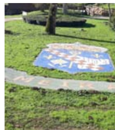
Dúas imaxes do renovado parque Profesor Río Barxa. Á dereita, o escudo de Meira