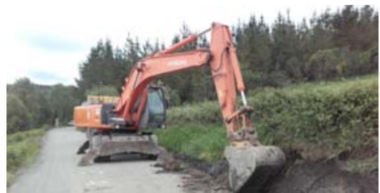
Máquina traballando na estrada de Momán ás Pontes

O principal instrumento de cooperación cos concellos co que conta a Deputación, o Plan Único, sube ata os 21,5M€ e abre unha nova liña de apoio ó sector servizos que resultou dos máis afectados pola crise.