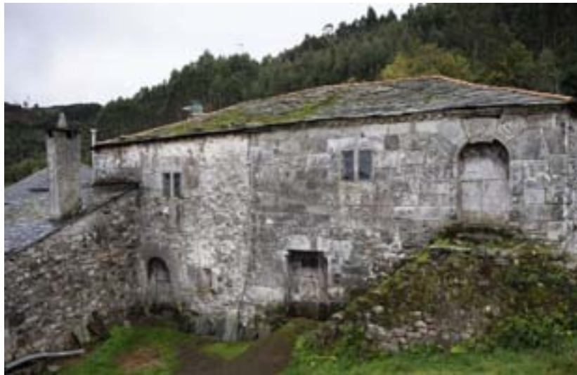
Unha vista da casa fortaleza de Silán e un detalle dun dos seus arcos. Abaixo, a fortaleza nun recorte antigo de prensa

Ademais, o escudo Municipal, aprobado en 1997, contén nas súas armas a imaxe de tres torres como recordo das tres fortalezas que existiron dentro das