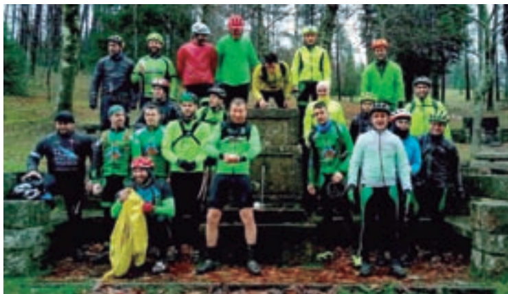
Membros do club nunha das actividades

do por Guitiriz, e visto o último roiteiro realizado, a xente este ano vén con moitas ganas e esperemos se celebren moitos máis.