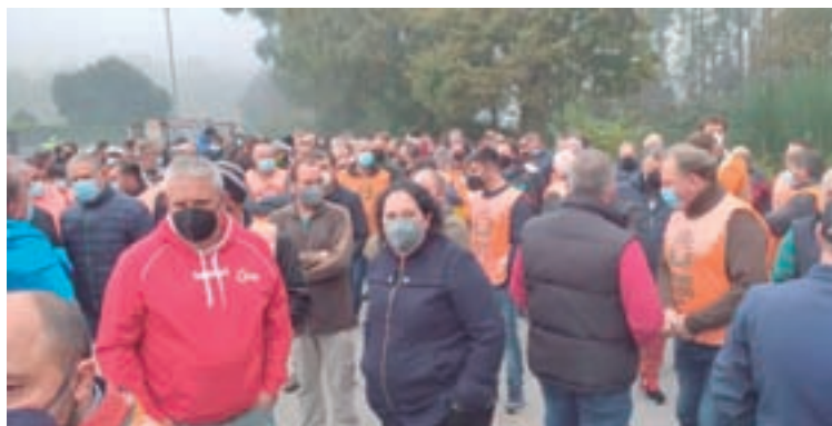
Imaxe dunha das concentracións ante as lácteas

sumidoras coñezan os abusos e ilegalidades que hai detrás das marcas que mercan”, din.