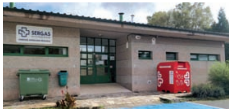
Centro de saúde de Muras