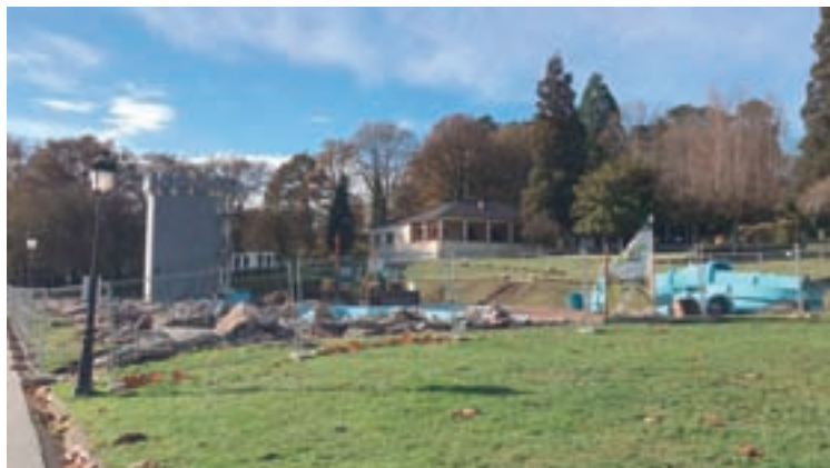
Obras de demolición do parque acuático de Vilalba

PARQUE ACUÁTICO. O Grupo Municipal Popular de Vilalba condena que o goberno local gaste 48.000 euros dos veciños e veciñas no