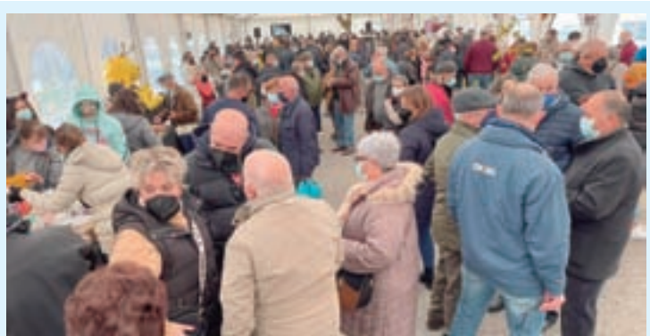
FEIRA DO MEL. Muras celebrou un ano máis a súa Feira do Mel da Montaña cun gran éxito de público e unha vintena de postos nos que se misturaron os de mel e os doutro tipo de produtos de alimentación.

Engade que “en Muras temos moitos problemas por resolver e a Xunta non se implica cos concellos só lle importan os intereses das grandes multinacionais”. Requeijo asegura que nos últimos anos recadáronse no termo municipal das eléctricas un total de 22 millóns de euros e a Muras só chegaron 5.