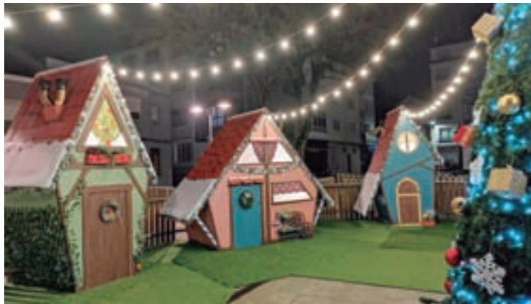
Imaxe do poboado do Nadal do 2020

está destinada a sesión de malabares a cargo de Oyun, o martes 28 ás 18.00 horas no Cine Alovi; e o día 30 Os fabulosos cleaners farán un espectáculo de pompas de xabón ás 18.00 horas no Cine Alovi, tamén con compra de entradas como nas anteriores.