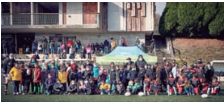
Participantes na I Xuntanza de Escola de Rugby

Pero este ano, nestes dous centros de infantil e primaria, en común acordo coa dirección e as anpas, estanse a levar a cabo actividades extraescolares, que tiveron unha espectacular acollida e que foron