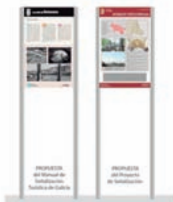
Unha mostra da nova sinalización

Dado o elevado número de recursos con que conta o concello estes agrúpanse por parroquias polo que haberá un panel por parroquia no que se recollerán os recursos turísticos da parroquia, localizados nun plano e con fotografías e información deta-