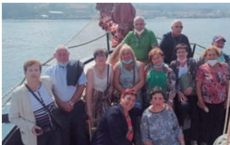
Mulleres do colectivo nunha das viaxes organizadas este ano

Pero ademais destas actividades diarias, o colectivo tiña por costume