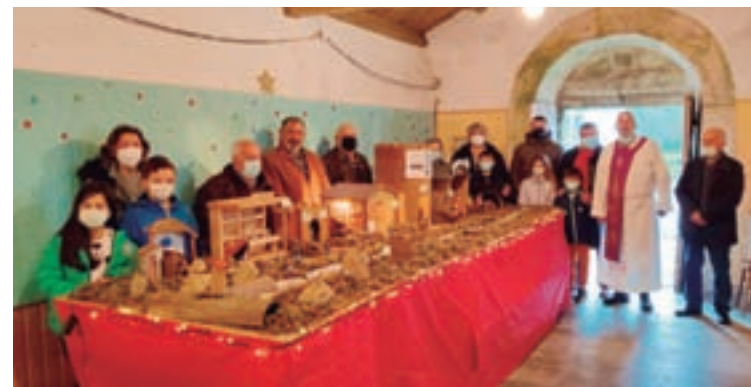
Belén de Momán o día da súa inauguración

Polo momento esta sexta vaga tamén trouxo dous novos falecementos, dúas persoas de idade avanzada con outras enfermidades. Espérase controlar esta situación co avance da vacinación.