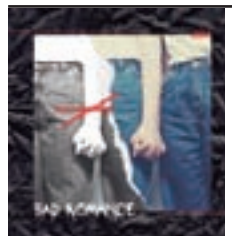
Calquera de Zeni N