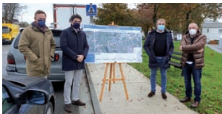
Presentación do proxecto das beirarrúas en Castro Ribeiras de Lea

A actuación realizarase na travesía da estrada autonómica LU-113, en concreto entre os puntos quilométricos 5,070 e 6, e vén a completar os traballos realizados o pasado ano no tramo comprendido entre os quilómetros 3,820 -á altura do campamento, preto de Duarría- e 5,070, cun investimento de 266.500 euros. En total, a Xunta destina 686.000 euros