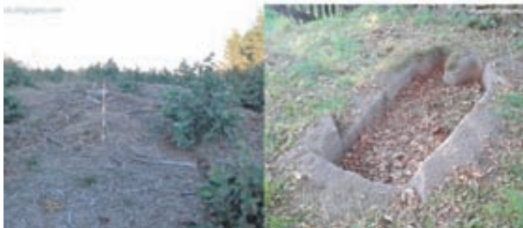
Dúas das mámoas documentadas

O Colectivo Patrimonio dos Ancares solicitou a Patrimonio da Xunta de Galicia a catalogación de varios bens que teñen documentados no concello de Outeiro de Rei.