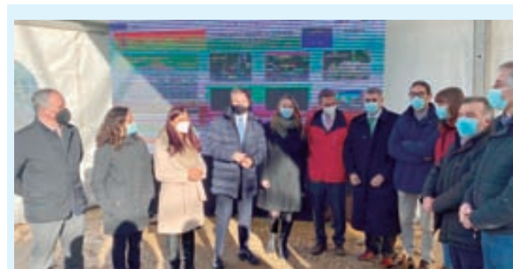
Acto de clausura da fase de probas

Ademais, este ano volverá a ver festa de Reis, que terá lugar o día 5 de xaneiro no salón de actos do Concello de Abadín durante a tarde. Como todos os anos, os nenos recibirán un agasallo das súas maxestades ademais de entregarlles as cartas ou explicarlles o que desexan. Ademais, haberá inchables no pavillón sempre e cando o permita a pandemia.