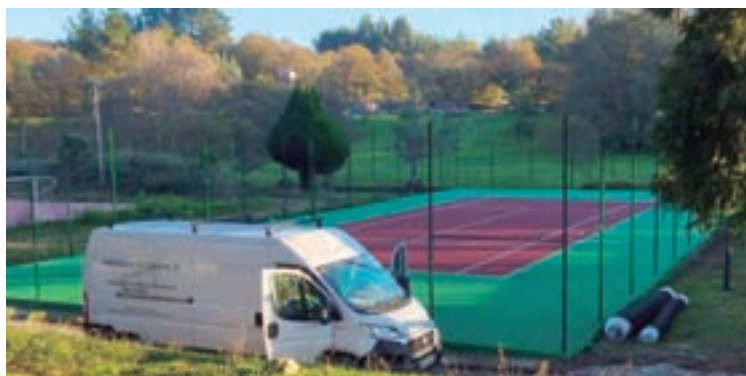
A pista de tenis na que se fixeron as obras

Outro dos proxectos que se rematou foi a Execución do adoquinado do Camiño Real no entorno do núcleo de Friol, que se levou a cabo gracias a unha subvención da Axencia Galega de Turismo. Dita subvención cu-