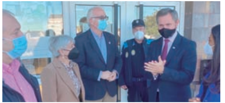
Miñones na súa visita ao Concello de Vilalba

José Miñones apuntou que na provincia da Lugo o Plan Único mobilizará 16,3 millóns en proxectos con 10,2 millóns aportados polo Estado. As actuacións benefician a 64 concellos e 45.514 familias ou