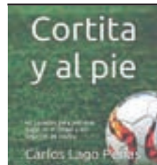
Cortita y al pié de Carlos Lago Peñas