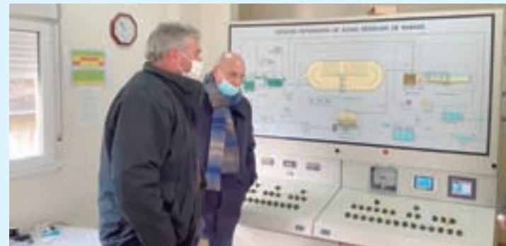
Supervisión das novas instalacións

O Concello vén de poñer en funcionamento os novos sistemas de control e mellora da calidade da auga, que foron executados en colaboración con Augas de Galicia, e que supuxeron un investimento de 80.000 euros, tanto na estación de abastecemento, como na depuradora. As melloras realizadas neste tempo consistiron na instalación dun sistema de control de calidade e cantidade dos verquidos con