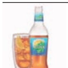
Unha copa de Viyuela ou un Nestea

Consulta os eventos en: www.terrachaxa.com