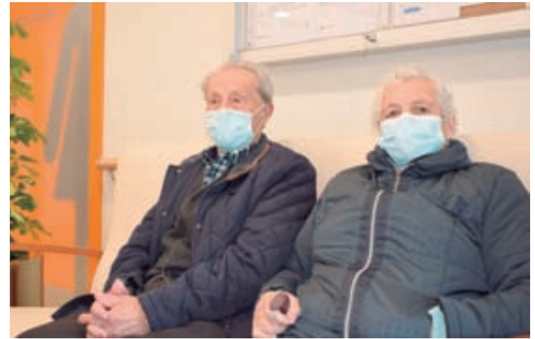
Primeiros usuarios do CAM

CARACTERÍSTICAS. O Centro de Atención a Maiores Santa María de Meira ocupa unha extensión de 3.312 m 2 , dos cales 734 m 2 están destinados ao edificio. Esta parcela atópase na rúa Grupo Escolar, no casco urbano da vila. O edificio conta con planta baixa coas seguintes dependencias: vestíbulo, recepción, aseos adaptados, baños asistidos, despacho de dirección, sala de curas, rehabilitación, sala polivalente, sala de convivencia, sala de terapia, comedor, servizos de cociña, servizos de lavandería e vestiarios do persoal.