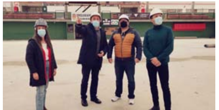
De arriba a abaixo, a rúa Monte Caxado, a pasarela e as obras do pavillón

rar a seguridade e accesibilidade. Durante todo o tempo de execución das obras, só estará habilitado un carril de circulación, nun único sentido, desde a Rúa Antonio Machado cara a Avenida de Ortigueira para, deste xeito, garantir a seguridade do alumando do CEIP.