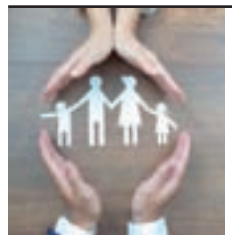
Desfrutar do tempo libre con familia ou amigos