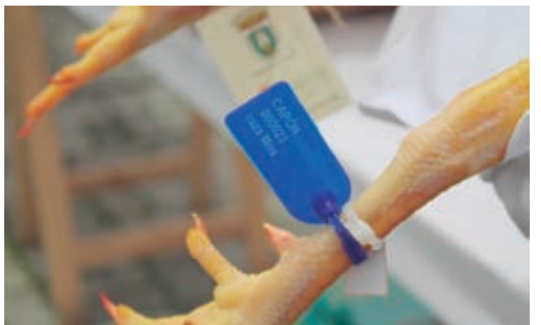
Arriba, imaxes de capóns na feira de Vilalba e, abaixo, un criadeiro e un detalle do distintivo do capón vilalbés