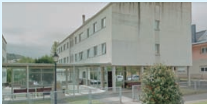
Vista das casas do maior de Riotorto

Vanse poñer en marcha dúas casas do maior, que funcionarán como centro de día con unha capacidade para 10 persoas.