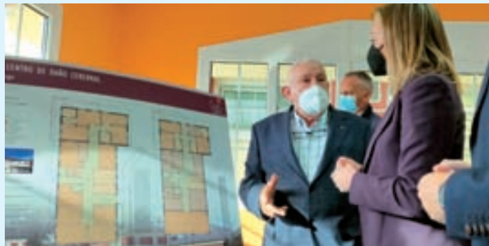
Visita da conselleira ao centro de atención a persoas con trastorno dual