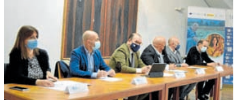
Firma do convenio no vicerreitorado de Lugo

O programa de axuda ás persoas mozas para contribuir ao reto demográfico é un dos trece programas que forman parte do novo Plan estatal de Acceso á Vivenda. O seu obxectivo é atraer xente moza aos concellos máis pequenos, facilitando o asentamento de poboación.