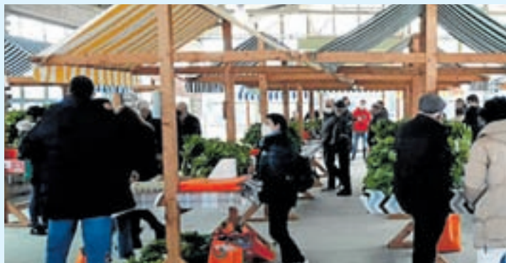
Un momento da feira celebrada en Abadín o 5 de marzo

Os 12 produtores presentes na décimo sexta edición de Expogrelo, celebrada non recinto feiral de Gontán, volveron verse as caras tras un ano sen feira e recuperaron antigas sensacións ofrecendo un produto de calidade total a un prezo fixado de 1,5 euros a mada. Sen dúbida axudou na xornada o bo día que saíu e que animou aos veciños dos arredores e visitantes asiduos a achegarse ata Abadín. Como en anos anteriores tamén houbo premios outorgados polo