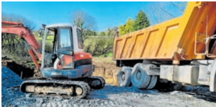
Obras de construción da balsa

Trátase dunha balsa de grandes proporcións que ten a dobre finalidade de utilizarse como depósito de auga para o servizo de protección contra incendios e tamén para usos gandeiros, xa que se pode utilizar para alimentar ao gando nos tempos de seca.