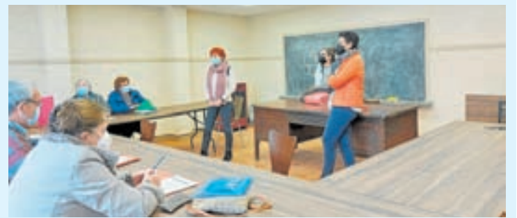
Inauguración da escola de San Cosme