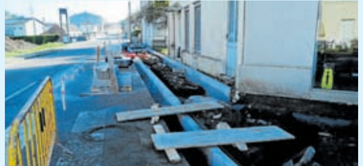
Obras das beirarrúas en Castro de Rei

Máis en detalle, as obras realizaranse na travesía da LU-113, entre os puntos quilométricos 5+070 e 6, onde o tránsito peonil en ambas as marxes da travesía é moi intenso porque acolle nu-