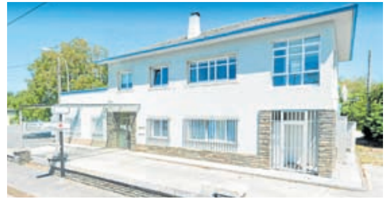
Centro de saúde de Outeiro de Rei

Na visita, conselleiro e alcalde avanzaron tamén no proceso de desenvolvemento da reforma do actual centro de saúde de Outeiro de Rei para ampliar a súa superficie en máis de 300 metros cadrados e acoller o Punto de Atención Continuada actualmente situado nunhas instalacións separadas e