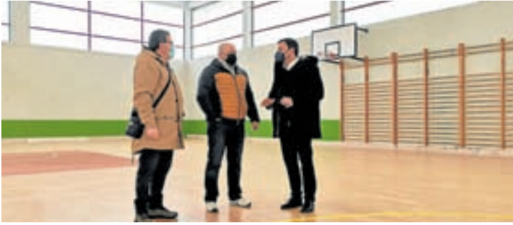
Visita do alcalde ao pavillón tralas obras