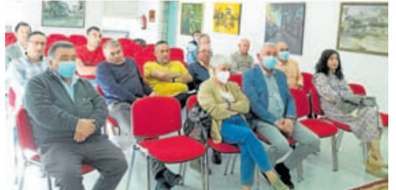
Reunión dos alcaldes da comarca co GDR

O investimento dos proxectos produtivos é de 1.077.000 euros cunha axuda de 456.000 euros. Os proxectos que recibiron axuda son a adecuación dun local para fabricación artesanal de xogos tradicionais, rehabilitación dunha adega para sidra, a creación dunha empresa de servizos industriais con drones, a creación duns apartamentos turísti-