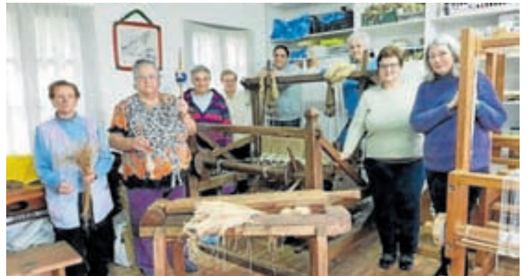
No local que utilizan na Casa Escola de Insua

Outro aspecto interesante que se recuperou foi todo o léxico relacionado con apeiros e tarefas, que varía segundo a zona e que deixara de