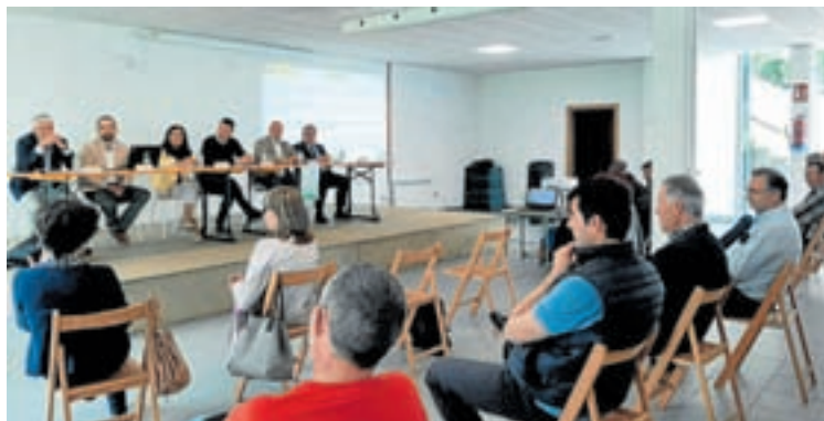
Presentación do proxecto aos veciños de Muras

O proxecto enmárcase nun reforzo ao investimento no territorio rural actuando en cada municipio a través de empresas, preferiblemente locais, para actualizar a información territorial co obxecto de crear un marco de seguridade xurídica para garantir o sostemento e a mellora da competitividade do sector agroalimentario, elementos para manter a