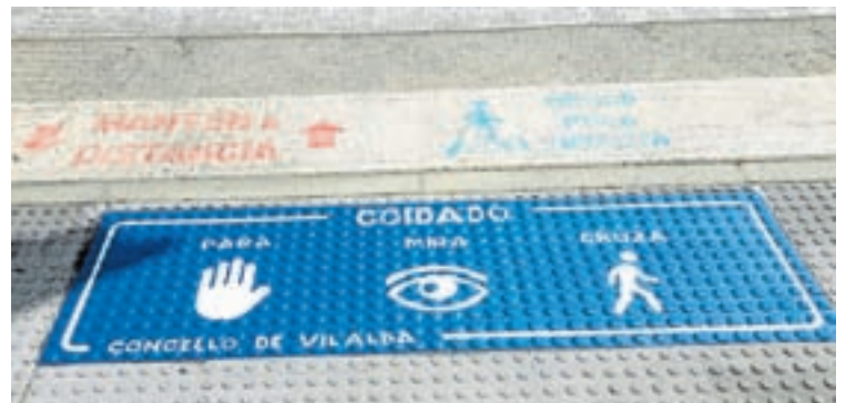
Arriba, o Rañego e, abaixo, a nova sinalización viaria