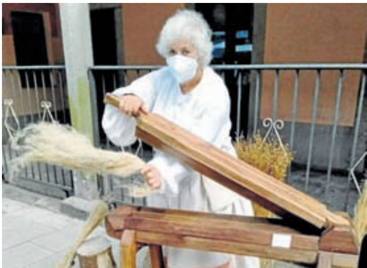
Traballo no banco tascón

A satisfacción polo traballo ben feito, o orgullo de recuperaren tradicións xa case esquecidas e de poñeren en valor un patrimonio tanto material como inmaterial inxustamente infravalorado e o reforzamento dos vínculos veciñais unen e animan a este grupo de mulleres a continuar coas súas actividades e fainas merecedoras sen dúbida do respecto e agradecemento do resto da sociedade.