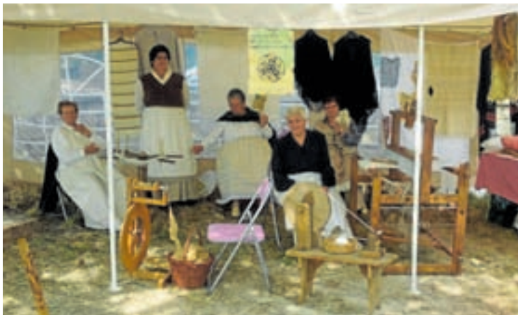
As mulleres de Insua promocionando a súa tradición

Gustoume moito cando mo propuxeron e decidíndome para dar a coñecer a tecedura. Como era tema de mulleres antes non se lle daba o valor que merece, como a todos os oficios das mulleres en xeral. Explíquei un pouquiño o que fago. Que dei moi agradecida.