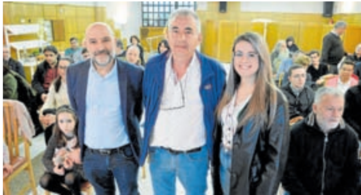
Arriba, a lista electoral do Partido Popular e, abaixo, os responsables do BNG

Así mesmo, o programa recolle a creación dunha liña de bonificacións fiscais destinada a axudar á pequena e mediana empresa e a redacción dunha nova ordenanza de tramitación co fin de reducir e simplificar os trámites para a obtención de licenzas de actividade, funcionamento, obras, etc..