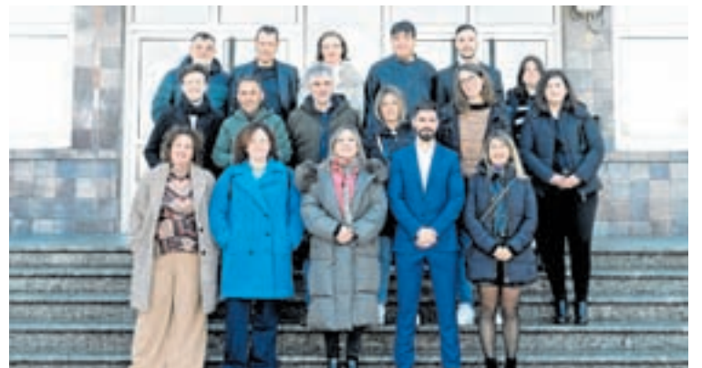
A candidatura socialista (arriba) e a de Vilalba Aberta