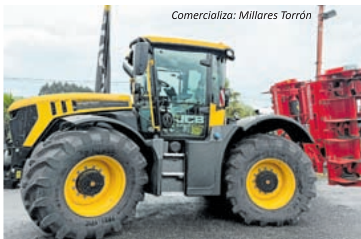
Comercializa: Millares Torrón