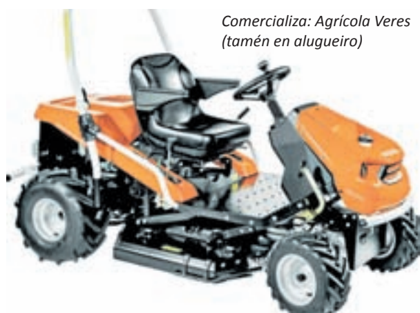
Comercializa: Agrícola Veres (tamén en alugueiro)