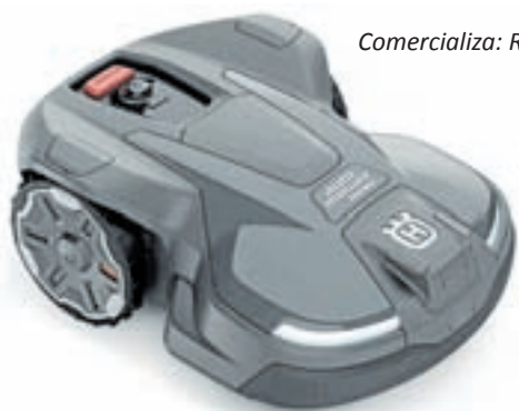
Comercializa: Reparaciones Carlos