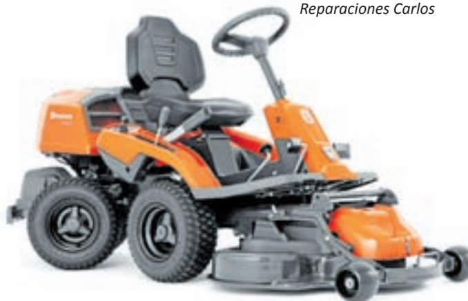
Comercializa: Reparaciones Carlos

Creáronse varias empresas que converteron nun pilar fundamental para o sector os servizos de venda, reparación e alugueiro de maquinaria