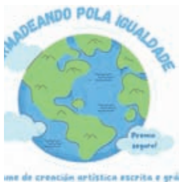
Concurso de creación artística escrita e gráfica

Os traballos deben ser inéditos e orixinais, presentados nun folio de tamaño DIN A4, sen utilizar medios dixitais para a súa realización. Entre-